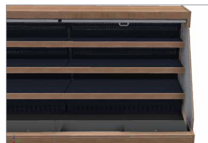
Store enrouleur (option)