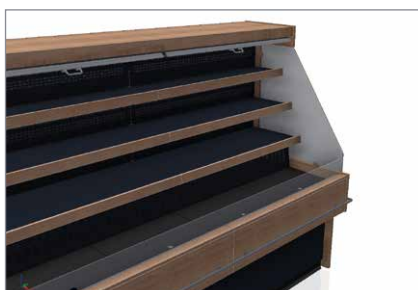
Agencement d'étagères flexible